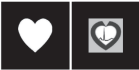
Figura 6. Marcadores de realidad aumentada.

ser usados desde su computadora en Internet, para lo cual tan sólo deberán poner las direcciones sugeridas bajo cada marcador en su browser, e instantáneamente desde su cámara web se mostrará en la pantalla un video de presentación, inicialmente, y posteriormente un objeto en tres dimensiones que representa el modelo del corazón virtual elaborado en el grupo de investigación del científico Jorge Reynolds Pombo. En conclusión, la realidad aumentada ha iniciado ya a mostrarnos sus amplias posibilidades desde donde, la Medicina en general, y la