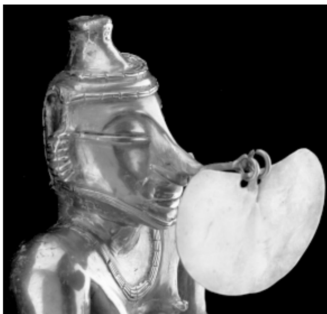
Cultura Quimbaya. Recipiente para cal en oro de 27 cm de alto. 400 a. C. - 400 d. C. Colección Museo del Oro. Banco de la República.

características del mundo de la red dan pie a una amplia gama de representaciones y juegos de rol, engaños, medias verdades y exageraciones, sobre todo porque el anonimato y la ausencia de señales visuales y auditivas lo permiten y, al mismo tiempo, nos aíslan de las consecuencias. Y aunque, en el fondo, en la red no somos tan anónimos, la distancia física y la poca presencia social hacen que nos sintamos menos inhibidos, más a salvo de ser descubiertos y un