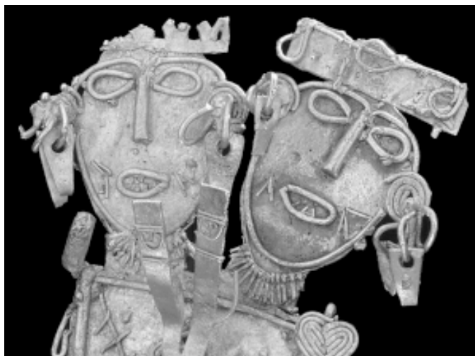
Cultura Muisca. Figura votiva en oro de 9 cm de alto (detalle). 600 d. C. - 1800 d. C. Colección Museo del Oro. Banco de la República.

Una forma de comprender las ideas que capturan la imaginación de la cultura es el estudio de la manipulación de ciertos objetos que las