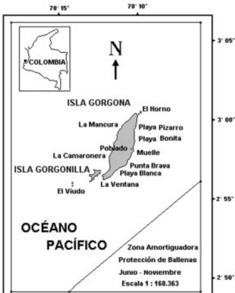
Figura 1. Área de estudio del Parque Nacional Natural Gorgona