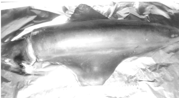
Figura 2. Vista dorsal del ejemplar encontrado.

Por otro lado, las aletas son anchas, su longitud es igual a la longitud del manto (~60 cm) y tienen una peculiar forma de rombo (Figura 2), de la cual deriva el nombre específico. El espécimen presentaba una coloración roja en la región dorsal y ventral del manto, así como en la región dorsal de la cabeza y los brazos. La cara ventral de estos últimos era blanca. El cartílago de inserción del sifón presentaba dos surcos, uno longitudinal largo y estrecho, y otro transversal corto y ancho, en forma de T invertida. El pico superior presentó una longitud rostral de 17 mm, mientras que en el inferior fue de 18 mm. Los brazos estaban mutilados en su región media, exceptuando el primer par (dorsal), siendo posible observar dos hileras de ventosas en la cara ventral de cada brazo. Los dos tentáculos estaban mutilados.